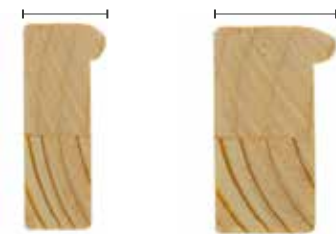
Museo 4,5 cm